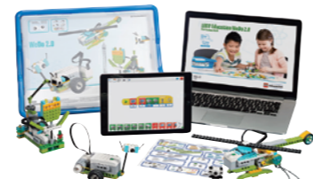
E31-7412 ※写真はイメージです。推奨年齢 小学校低学年以上