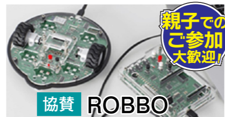
※写真はイメージです。センサーを利用したロボットプログラミングや、3Dプリンターを使った立体図形の作り方を学ぼう!