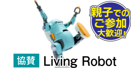
※写真はイメージです。スクラッチでロボットプログラムを体験! パソコン上でロボット目線での景色も確認できるよ。

16(月)17(火)18(水) ① 11:00 ▶ 12:00 ② 13:00 ▶ 14:00