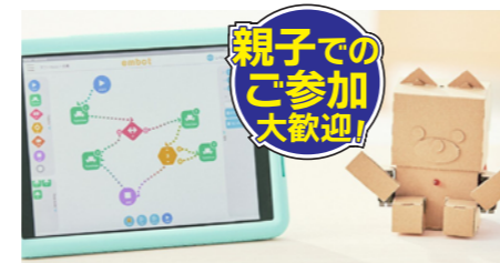
※写真はイメージです。身近な素材の段ボールで作ったロボットを、自由に動かす体験をしてみよう! スマホのしくみも学べちゃう!